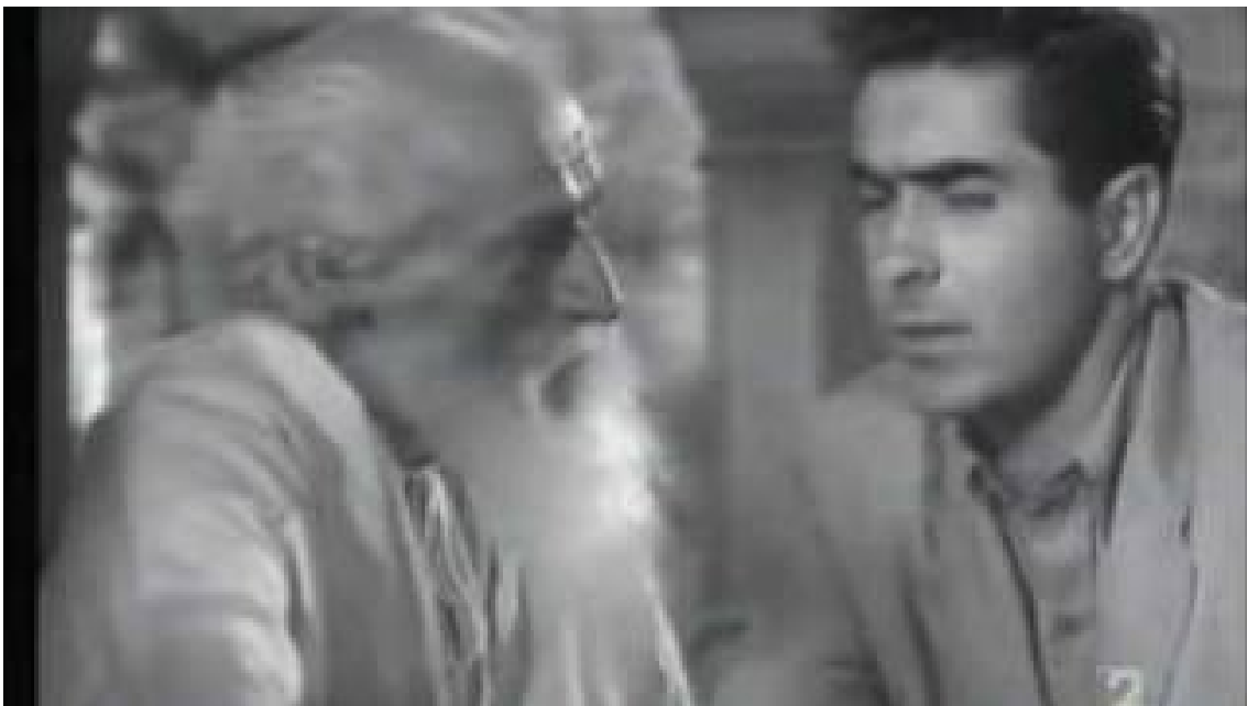
Fotograma de "El filo de la navaja"

Davant tot això, semblava que el desllorigador del posicionament ideològic era declarar-se agnòstic i, com a intel·lectual, partidari del mètode materialista dialèctic, per la seva major eficàcia cognoscitiva. El cert es, però, que aquest posicionament no el vaig prendre mai del tot d'una manera activa, doncs molt aviat em tornarien els conflictes interns entre raonament i sentiment. Ara, però en sentit invers d'abans: la raó no em satisfia el sentiment.