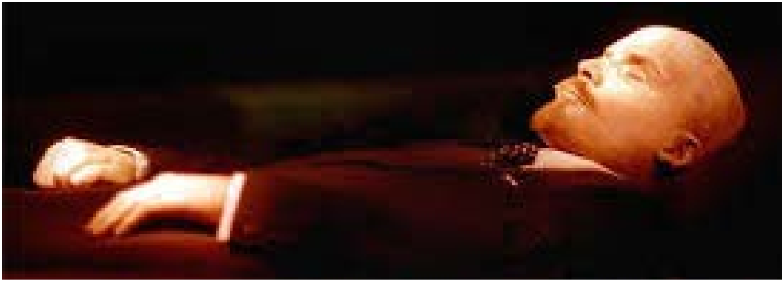
Cos "incorrupte" de Lenin

Des de la psicologia decimonònica de Sigmund Froid i l'epistemologia de Jean Piaget, sabem que tot el nostre sistema de referències cognoscitives sobre el mon, l'home i els seus valors és fixat en el nostre inconscient en la primera infantesa.