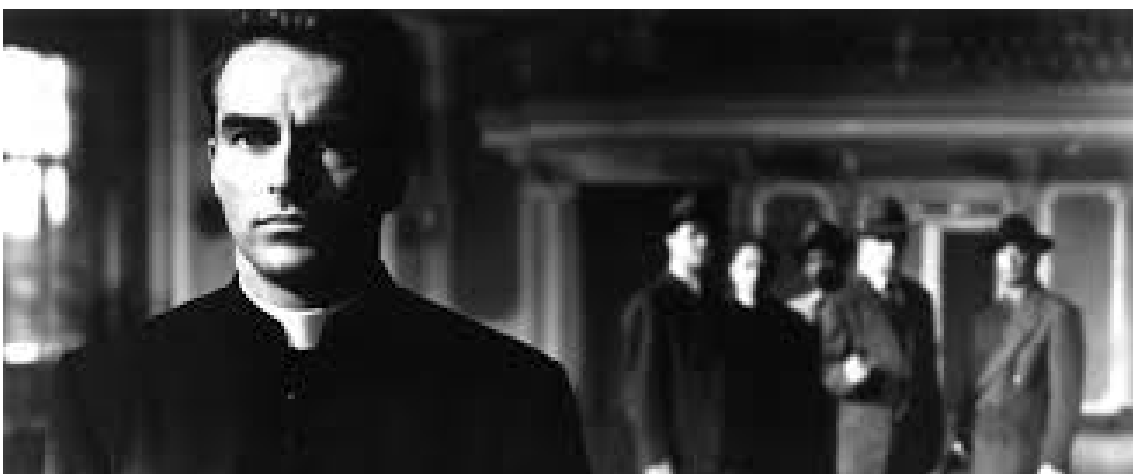
Fotograma de "Yo confieso"

Malgrat aquest actual desprestigi -que es dona en general, però no en moltíssims casos particulars- la confessió i el perdó absolut, amb la sacralització de secret per part de qui la sent, crec que es un altre legat cultural a mantenir i que -i amb una prèvia i autèntica posta al dia- cal recuperar.